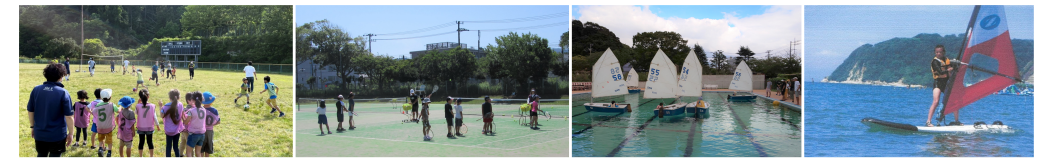
写真:左から>サッカー広場(スポーツイベント&教室)、ジュニアテニス、ジュニアヨット、ジュニアウインドサーフィン(以上ジュニアスポーツ教室)